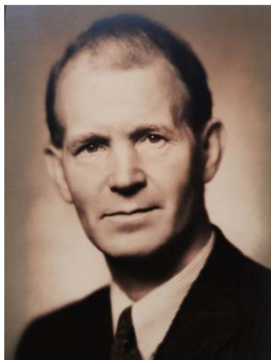
Sonen Johannes Anton