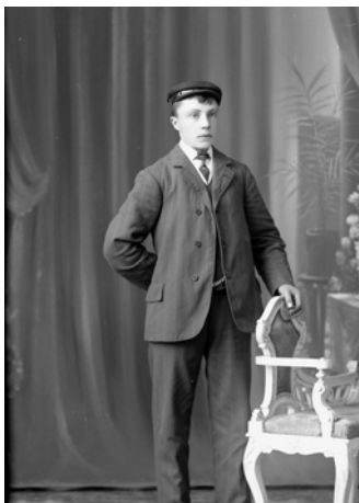
Martin 1911.