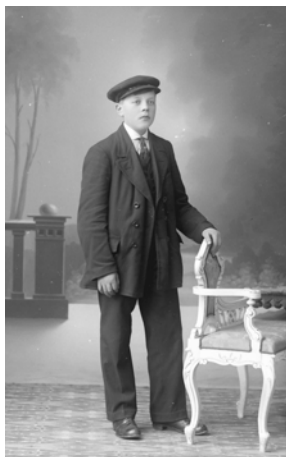
Oskar 1915.