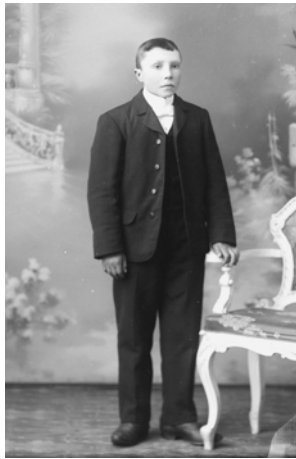
Martin 1907.