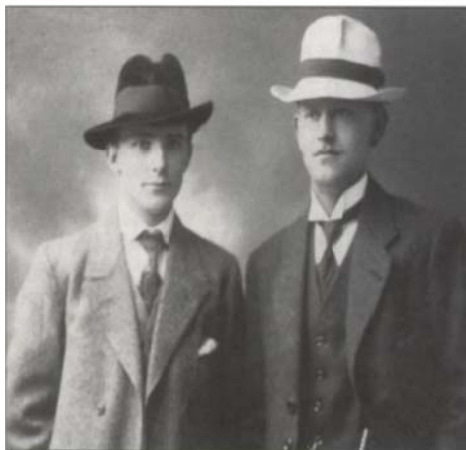
Hjalmar Johansen til venstre og Gunnar Kjær.