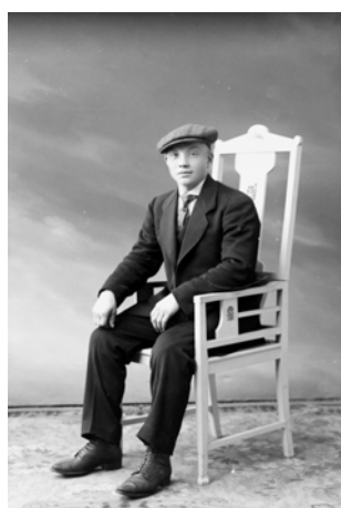
Ole 1912.