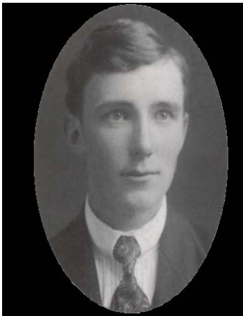
Hjalmar Johansen.