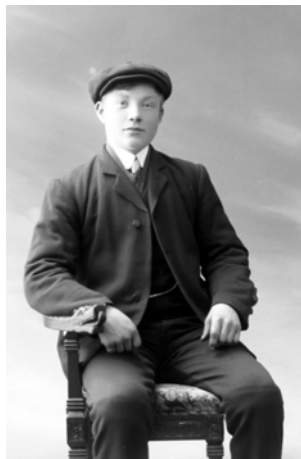
Ole 1912.